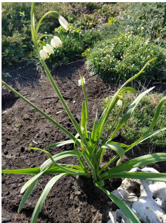
Рис. 1. Загальний вигляд рослини L. aestivum .

Квітки L. aestivum 2,6–3 см завдовжки, білі із зеленою плямкою на верхівці, пониклі (рис. 1–5). Квітконіс 25–45 см завдовжки та діаметром у 0,6 см, 3–10 квіток у суцвітті. Приквітки дві конусоподібні, близько 4,6–4,8 см завдовжки, завширшки 1,4 см, шкірясті, світло-коричневі. Квітконіжка 5,2–5,8 см завдовжки, близько 0,2 см в діаметрі. Листочки простої оцвітини (пелюстки) близько 1,8–2,9 см завдовжки та 0,6–0,9 см завширшки із загостреною верхівкою з зеленою плямою.